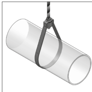
Collare Pensile SLH